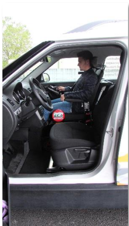
Magix New Live