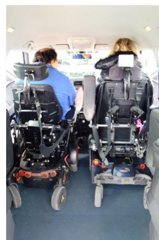
Permobil F5 et C500