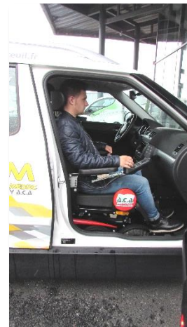
Magix New Live