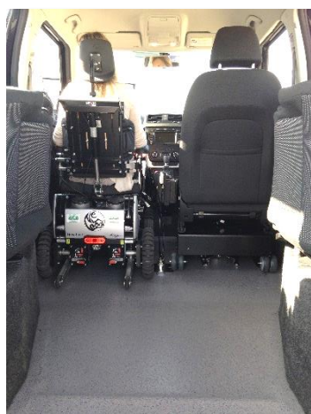
Magix New Live