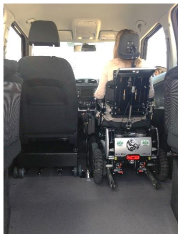
Magix New Live