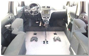
Fixation fauteuil roulant