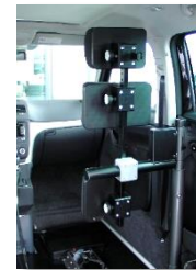
Appui-tête, appui- dos pour FRM