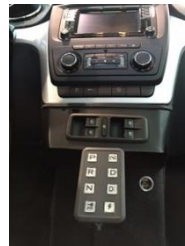
Passage de vitesse RASH