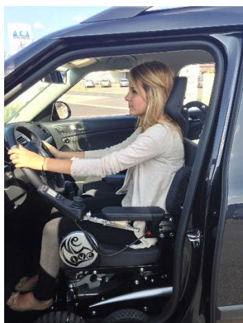
Magix New Live