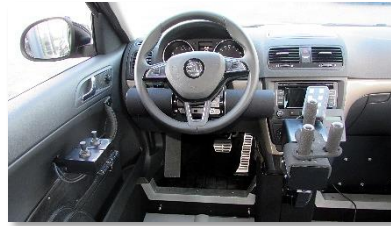
Joystick avec retour d'effort